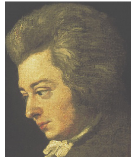
Mozart am Klavier unvollendetes Ölbild von J. Lange

Mozart befand sich mitten in der Arbeit an „Figaros Hochzeit“ (Uraufführung am 1. Mai 1786), als er von seinem Verleger Franz Anton Hoffmeister den Auftrag für die Komposition von drei Klavierquartetten erhielt. Hoffmeister wollte die drei Klavierquartette den Wiener Musikliebhabern in seinen regelmäßig erscheinenden Heften mit neuer Klaviermusik zu Subskription anbieten.