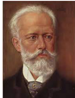
Peter Iljitsch Tschaikowskij