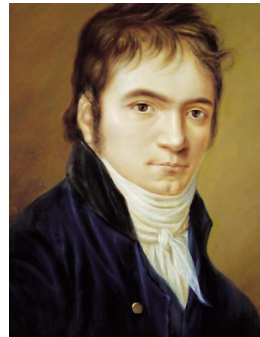
Ludwig van Beethoven (Elfenbeinminiatur 1802)

Zur selben Zeit wie die Grande Sonate Pathétique komponierte Beethoven das Septett für Streicher und Bläser in Es-Dur op. 20 . Er widmete es Maria-Theresia von Neapel – Sizilien, der zweiten Ehefrau von Kaiser Franz II. Da es höchst unpassend gewesen wäre, einer so hoch gestellten Persönlichkeit ohne deren vorherige Zustimmung eine Komposition zu widmen, half ihm Gräfin Anna von Brunsvik, die Mutter von Josephine von Brunsvik, mit ihren Beziehungen zum Hof. Die junge Kaiserin sagte zu, als Widmungsträgerin zu fungieren und war von dem Werk begeistert, das im Rahmen von Beethovens erster Akademie im kaiserl. königl. National-Hof-Theater am 2. April 1800 uraufgeführt wurde.