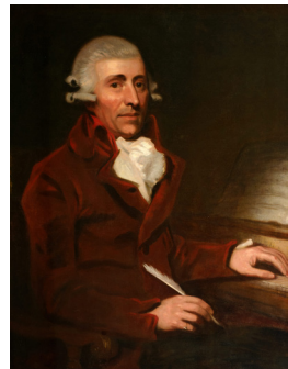
Joseph Haydn. Portrait von John Hoppner

In der Gattungstradition, aus der Haydns frühe Klaviertrios stammen, blieb das Tasteninstrument stets dominant; Violine und Violoncello hatten nur eine begleitende Funktion. Charakteristisch für diese Auffassung ist die bis ins 19. Jahrhundert hinein für den Druck vorgesehene Gattungsbezeichnung „Sonate für Cembalo (Fortepiano) mit Begleitung von Violine und Violoncello“. Eine kompositorische Weiterentwicklung im Sinne dieser Tradition ist in Haydns frühen Klaviertrios zwar ablesbar, hielt sich aber innerhalb der strikten Grenzen des Genres.