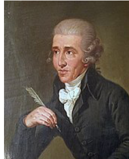
Joseph Haydn Ölgemälde von Guttenbrunn

Aus der frühen, umfangreichen Werkgruppe der Streichtrios für zwei Violinen und Bass oder – wie Haydn in seinen späten Jahren im Entwurfskatalog nachtrag – „für zwei Violinen und Violoncello“ erklingt 2024 beim 15. Musikfest Schloss Weinzierl das Divertimento a tre Hob. V:16 in C-Dur. Die 21 zweifelsfrei von Joseph Haydn stammenden Divertimenti a tre bilden die wichtigste kammermusikalische Gattung aus Haydns frühester Schaffensperiode. Das Streichtrio C-Dur , welches das Festkonzert eröffnet, gehört dem Zyklus Hob. V:15-20 an, einer Gruppe von Divertimenti a tre , die Haydn früh komponierte und in einen Zyklus zusammenfasste.